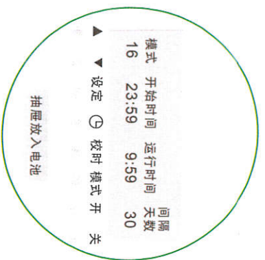
干电池液晶款控制器