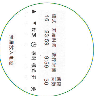
太阳能液晶款控制器