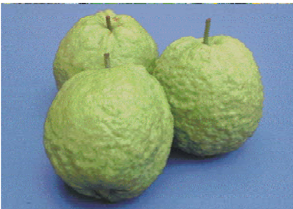
↑ 「台農1號—帝王拔」是新推出的品種，有申請植物品種權保護，不可私自繁殖