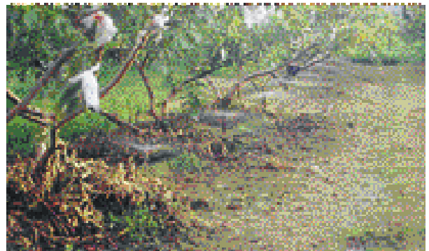
↑ 番石榴園肥灌可節省人力，並適時提供植株生長所需養分