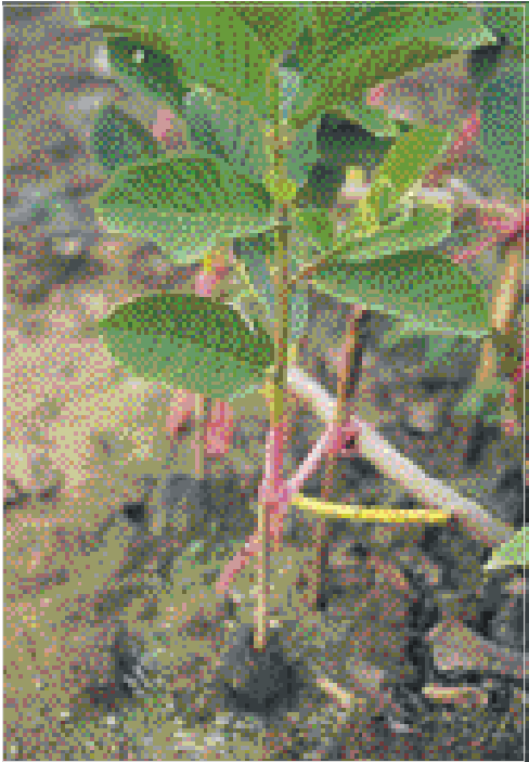
↑ 番石榴地面靠接繁殖是台灣種苗商最常用的繁殖方法，種植時應注意根瘤線蟲之防治

目前水果分級裝箱後隨一般果品運至國內市場銷售，運輸過程無冷藏設備，但運送過程應儘可能避免日曬，至超市也應儘可能維持低溫，以保持產品的新鮮。外銷則須以冷藏貨櫃運輸，且需考慮與其他類水果併櫃時的貯藏條件。果品之品管極為重要，應有人員負責田間及集貨場之抽驗與管制，以維持品牌之信用。