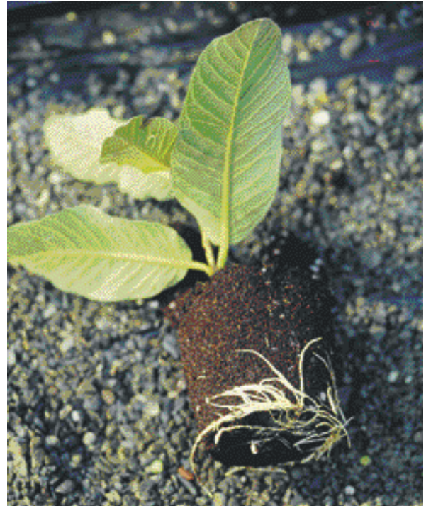
↑ 番石榴扦插繁殖根系發育良好，沒有線蟲感染