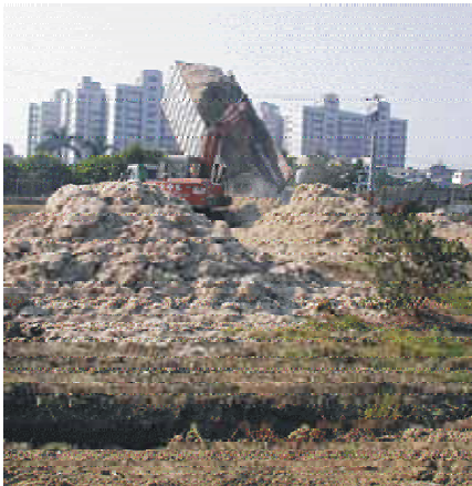
↑ 碳氮比高的蔗渣是改良土壤的好資材，施用蔗渣與土壤一同翻耕，浸水一段時間才可種植