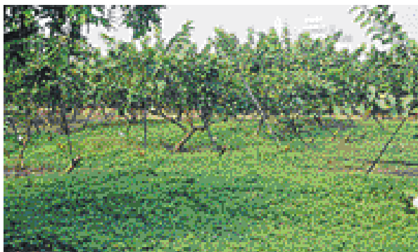
↑ 番石榴園草生栽培情形