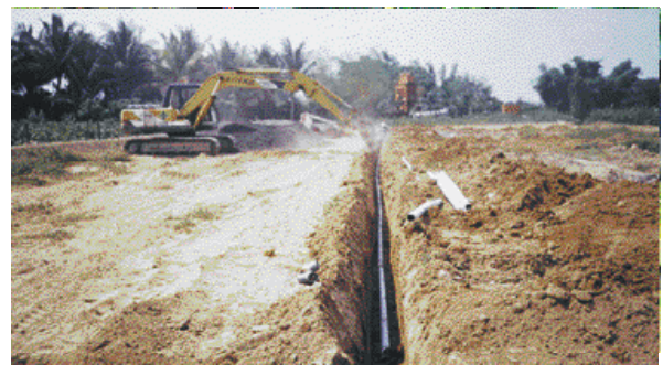
↑ 番石榴植株不耐浸水，排水不良的果園設置暗管排水情形