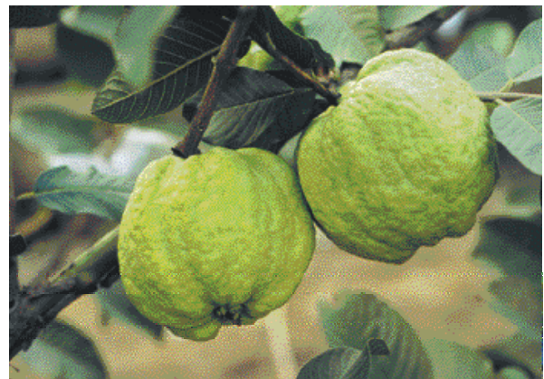
↑ 少籽「水晶拔」產量不高、管理費工，單價雖較高，但栽培面積漸少