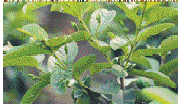
↑ 利用回剪結果枝或摘除頂芽，可誘使再次開花結果