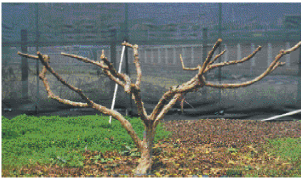
↑ 培育良好樹型，產量、品質均較佳，更方便管理工作(為展示樹型施行強剪，一般栽培不可強剪)