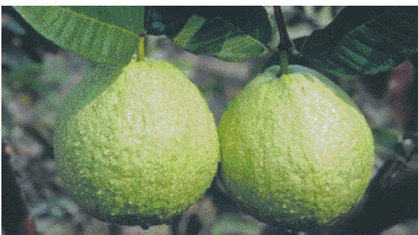
↑ 「珍珠拔」為台灣目前栽培最多的品種，市場佔有率超過90%